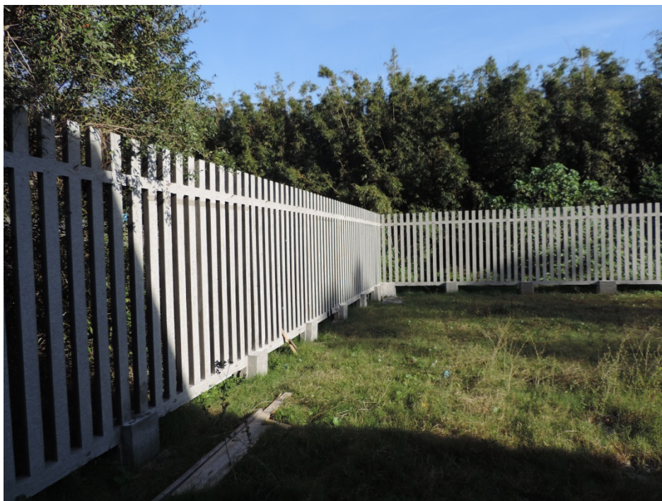
Foto 1- Gradil pré-moldado

O gradil de concreto será usinado com fck mínimo 20MPa para os blocos de coroamento e 15 MPa para as micro estacas.