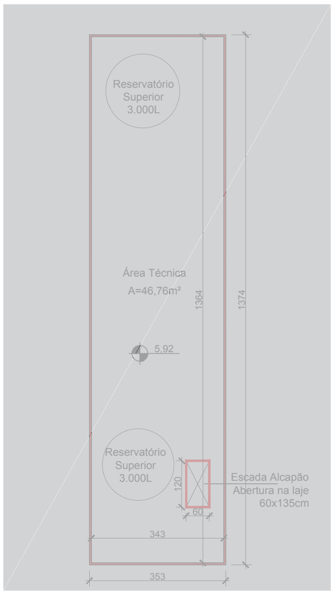
PLANTA RESERVATÓRIO- ARMAZÉM A5 Esc. 1:100