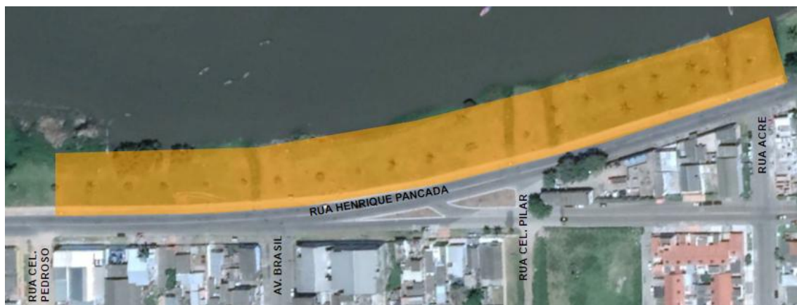
FIGURA 1 – Área de intervenção na Orla da Rua Henrique Pancada - Etapa 2

O presente documento tem por objetivo estabelecer critérios, especificar materiais e descrever os serviços técnicos a serem desenvolvidos pela CONTRATADA, ganhadora do processo licitatório, no que tange ao Projeto de Revitalização da Orla da Avenida Henrique Pancada - Etapa 2.