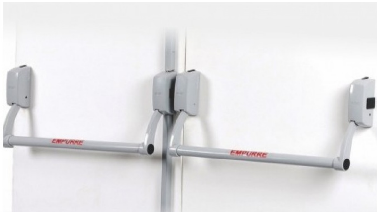
Figura 2 - Imagem Referência - Barra antipânico dupla.