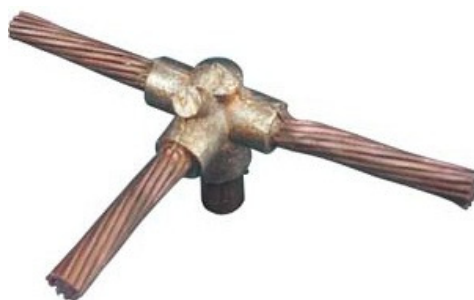
Figura 9 - Imagem Referência – Solda exotérmica na união dos cabos de cobre nu.

A união entre o cabo de equalização e as hastes de aterramento deverá ser exotérmica, utilizando o equipamento “Cadinho” e material próprio para solda exotérmica, bem como o material para ignição específico para esse tipo de procedimento. Para evitar que o material da solda vaze pelo cadinho, deverá ser utilizada massa de vedação específica nos vãos do equipamento. A solda deverá ser realizada sem que os cabos estejam tracionados, para evitar que se movimentem durante o procedimento.