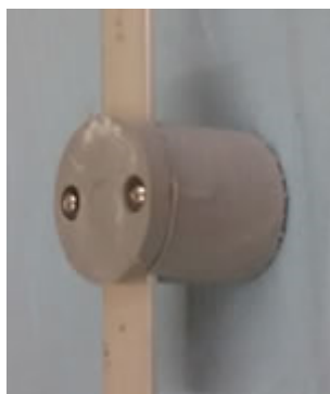
Figura 7 - Imagem Referência - Isolador Gelcan