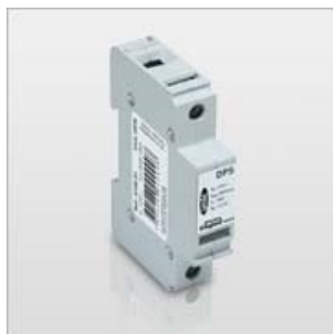
Figura 11 - Imagem Referência – Dispositivo de Proteção Contra Surtos.

Deverá ser colocado dois Dispositivos de Proteção Contra Surtos (DPS) junto ao medidor geral, ligados em série com a rede de alimentação. A fixação deverá ser pela base, por engate rápido sobre trilhos. Para que exista um bom contato entre as conexões, é necessário manter apertados os parafusos e porcas correspondentes. Deverá ser de classe 1 e possuir tensão nominal de 350V, frequência nominal de 50/60Hz, corrente nominal de descarga de 40Ka, por pólo, nível de proteção 1,5 KV, módulo de proteção plugável. Deverão ter uma vida média de, pelo menos, 20 mil manobras mecânicas e/ou elétricas com corrente nominal. O disparo, em caso de curto-circuito, deverá ser entre 7 e 10 x I_n .