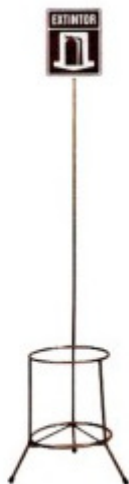
Figura 4 - Imagem Referência – Suporte de extintor tripé, com haste de identificação.

pintado com tinta esmalte sintética na cor vermelha, contendo haste de identificação, conforme figura que segue: