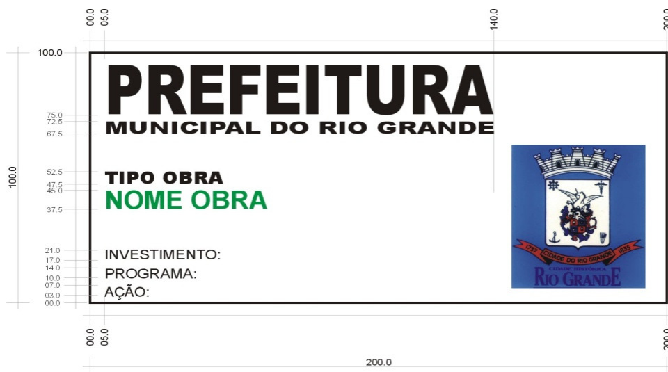
Figura 1 - Imagem Referência – Layout da placa da obra.

A CONTRATADA deverá manter até o final da obra, em local visível, placa da obra. Será de sua responsabilidade a confecção e fixação da placa, que deverá ser confeccionada em chapas planas, metálicas galvanizadas ou de madeira impermeabilizada, desde que em material resistente a intempéries. Será fixada em local bem visível, preferencialmente no acesso principal da escola, voltada para via pública, favorecendo a sua visualização. A placa deverá ser mantida em bom estado de conservação durante todo o período de execução da obra. Sua dimensão será de 2,00m x 1,00m, com layout definido pela Prefeitura Municipal do Rio Grande.