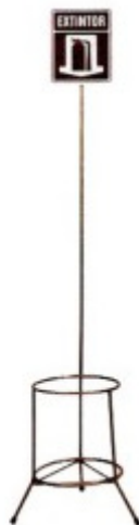
Figura 3 - Imagem Referência – Suporte de extintor tripé, com haste de identificação.

pintado com tinta esmalte sintética na cor vermelha, contendo haste de identificação, conforme figura que segue: