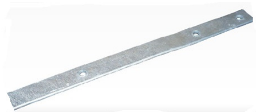
Figura 5 - Imagem Referência - Barra Chata de Aço Galvanizado

As descidas serão realizadas conforme os locais indicados no projeto, utilizando barra chata de aço galvanizado 7/8" x 1/8", interligadas entre si com parafuso de cabeça chata e afastados das paredes por meio de isoladores do tipo GELCAN de base ondulada, fixados a cada 1,50m. Os três últimos metros de descida deverão estar protegidos com eletroduto de PVC rígido antichama de 1", fixados por abraçadeiras metálicas de mesmo diâmetro a cada 1,00m, com buchas e parafusos de 10 mm.