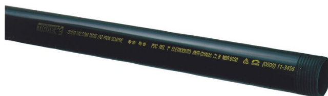
Figura 7 - Imagem Referência – Eletroduto de PVC rígido 1”.

A união entre o cabo de equalização e as hastes de aterramento deverá ser exotérmica, utilizando o equipamento “Cadinho” e material próprio para solda exotérmica, bem como o material para ignição específico para esse tipo de procedimento. Para evitar que o material da solda vaze pelo cadinho, deverá ser utilizada massa de vedação específica nos vãos do equipamento. A solda deverá ser realizada sem que os cabos estejam tracionados, para evitar que se movimentem durante o procedimento.