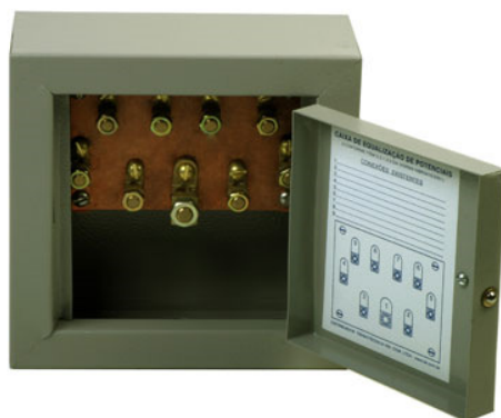
Figura 9 - Imagem Referência – Caixa equalizadora.

Deverá ser colocado dois Dispositivos de Proteção Contra Surtos (DPS) junto ao medidor geral da escola, ligados em série com a rede de alimentação. A fixação deverá ser pela base, por engate rápido sobre trilhos. Para que exista um bom contato entre as conexões, é necessário manter apertados os parafusos e porcas correspondentes. Deverá ser de classe 1 e possuir tensão nominal de 350V, frequência nominal de 50/60Hz, corrente nominal de descarga de 40Ka, por pólo, nível de proteção 1,5 KV, módulo de proteção plugável. Deverão ter uma vida média de, pelo menos, 20 mil manobras mecânicas e/ou elétricas com corrente nominal. O disparo, em caso de curto-circuito, deverá ser entre 7 e 10 x I_n .