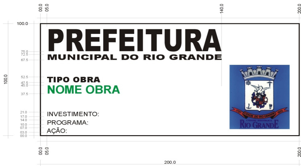
Figura 1 - Imagem Referência – Layout da placa da obra.

A CONTRATADA deverá manter até o final da obra, em local visível, placa da obra. Será de sua responsabilidade a confecção e fixação da placa, que deverá ser confeccionada em chapas planas, metálicas galvanizadas ou de madeira impermeabilizada, desde que em material resistente a intempéries. Será fixada em local bem visível, preferencialmente no acesso principal da escola, voltada para via pública, favorecendo a sua visualização. A placa deverá ser mantida em bom estado de conservação durante todo o período de execução da obra. Sua dimensão será de 2,00m x 1,00m, com layout definido pela Prefeitura Municipal do Rio Grande.