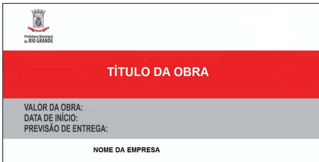
FIGURA 1 – Modelo de Placa Prefeitura Municipal do Rio Grande.

A placa deverá ser confeccionada em chapas planas, metálicas galvanizadas ou de madeira impermeabilizada, em material resistente a intempéries. Deverá ser fixada em local bem visível, preferencialmente na fachada principal da edificação, voltada para via pública que favoreça a visualização. Recomenda-se que a placa seja mantida em bom estado de conservação, durante todo período de execução da obra.