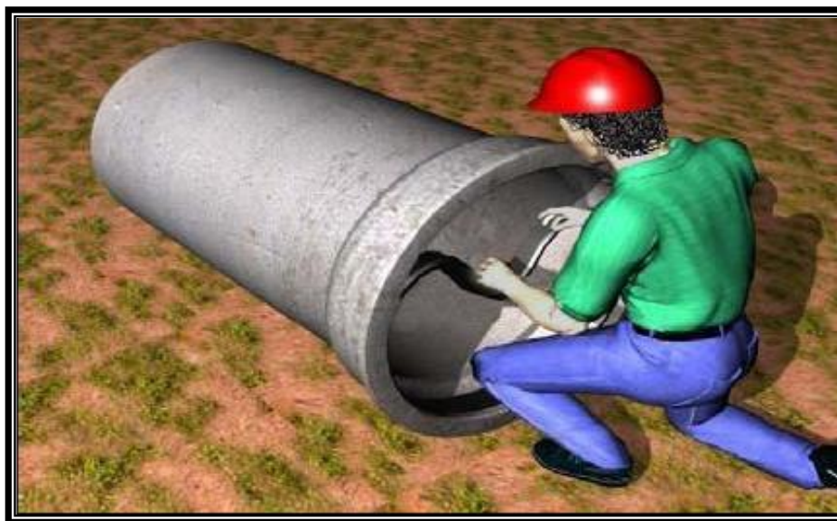
Figura 11- Colocação do anel de borracha

Os anéis redondos (rodantes) alojam-se na ponta do tubo, não devendo ser aplicado qualquer tipo de lubrificante.