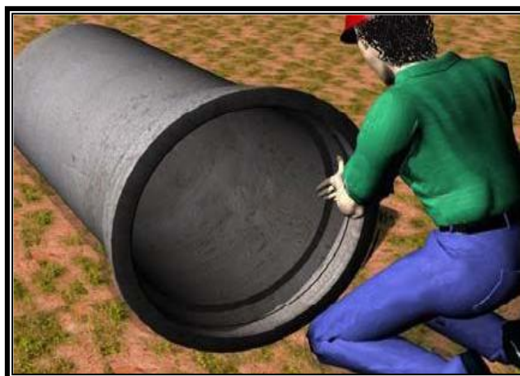
Figura 12 - Lubrificação do anel de borracha

As juntas em forma de cunha deverão estar em seu alinhamento final antes do acoplamento, sendo necessário lubrificar o anel para facilitar a introdução da ponta (figura10).