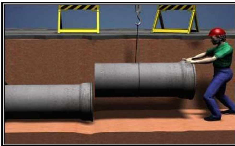
Figura 13– Acoplamento de tubos de concreto

Para o acoplamento, os tubos deverão ser suspensos em através de cabos de aço ou cintas apropriadas para içamento de cargas (figura 13), cuidando-se do seu alinhamento e do contato entre os extremos a acoplar. Durante esta operação, o tubo a ser acoplado não deve estar apoiado no fundo da vala, e sim suspenso (figura 13).