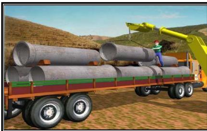
Figura 9. Descarregamento dos tubos