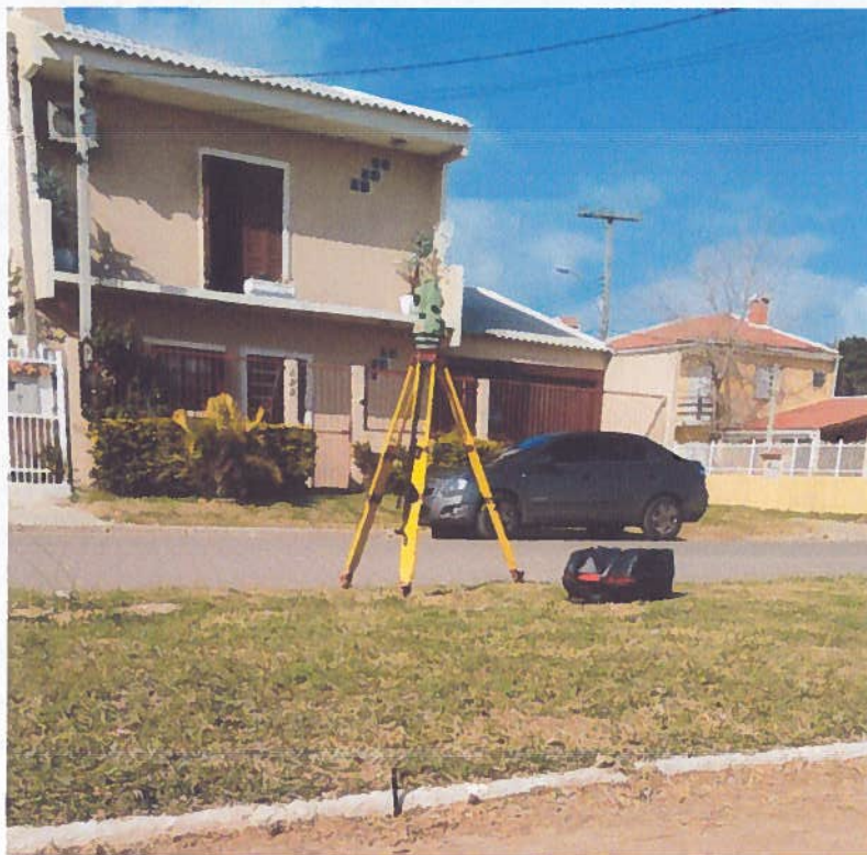
Figura 3 - Levantamento Cadastral.

esquinas e demais pontos que foram julgados necessários à boa caracterização do cadastro. A Figura 3 demonstra o equipamento em campo.