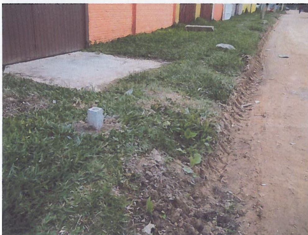
Figura 2 - Marco de Concreto instalado no local.

A escolha destes pontos deu-se devido à facilidade de acesso das mesmas à via de projeto. Quanto à materialização, os marcos são facilmente observados no terreno e seguem o modelo de padronização estabelecido pelo Instituto Brasileiro de Geografia e Estatística - IBGE, sendo eles de concreto em formato tronco-piramidal com uma chapa metálica incrustada em seu topo para identificação do ponto, conforme Figura 2 abaixo.