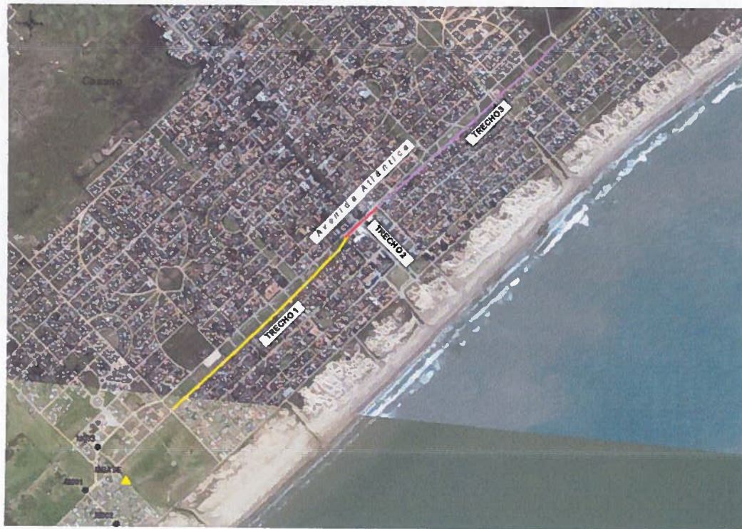
Figura 1 – Espacialização dos trechos contemplados pela ciclovia/ciclofaixa.

Ponto final: na interseção da Avenida Atlântica com a Rua Passo Fundo, coordenadas planas LTM N 6439594.672, E 391815.016. Extensão: 1.404,56 metros.