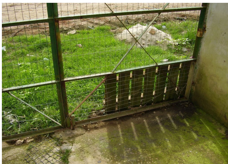
Portão de fundos

16 - Nos novos canis para filhotes executar camada de concreto (com pedrisco), espessura mínima de 3 cm, com inclinação de forma a escoar a água de limpeza para os dutos de 75 mm existentes, que, por sua vez terão destino a uma nova fossa a ser colocada no lado externo, entre o muro e o filtro existente.