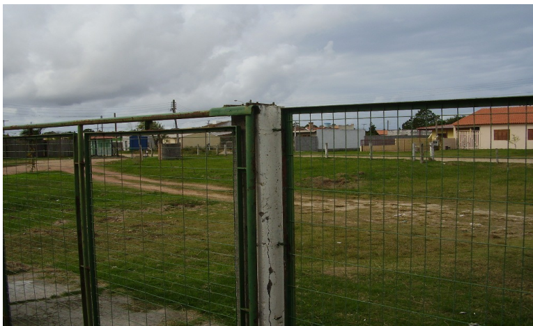
Tela do muro de frente

8 - Substituir por novos os quadros com tela (7) do muro da frente (painéis com altura de 1,25 m - área total de 19,50 m 2 ), aplicar galvanização a fogo, fundo para galvanizado e pintura esmalte sintético (cor verde). Os quadros serão constituídos por cantoneiras 1 1/4" com fixação aos pilares por meio de barra quadrada de 1/2" (3 em cada lateral).