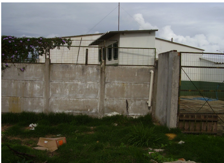
Cobertura das baias novas para filhotes

12 - Prolongar em 1,60 m a cobertura sobre as baias novas para filhotes, com mesmo modelo da telha existente e a colocação de 3 pilares de madeira de lei 10 x 7,5 cm, tipo "sanduiche" (duplado) sobre cantoneira "U" 3"x4"x4", espessura 1/4", galvanizada e fixada ao piso de concreto. Os pilares de madeira serão fixados às cantoneiras da base por meio de parafusos, porcas e arruelas galvanizados. Entre os pilares haverá uma viga também de madeira de lei 5x15 cm, comprimento 3,50 m. Os pilares e a viga receberão fundo fosco e pintura esmalte.