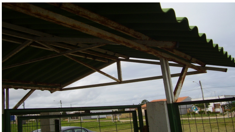
Alpendre de entrada

1 - Lixar/escovar/limpar e aplicar galvanização a frio nos elementos metálicos da estrutura (inclusive apoios) da cobertura do alpendre de entrada, aplicar fundo para galvanizado e pintura esmalte sintético (cor verde). A área total de projeção horizontal da estrutura é de 20,10 m 2 .