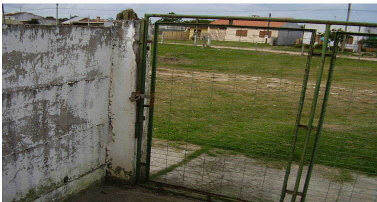
Portão de veículos do muro da frente

10 - Substituir por novo o portão "de correr" (para veículos) do muro da frente (3,60 x 1,90 m - área total de 6,84 m 2 ), com mesmas especificações do existente e reaproveitamento dos rodízios; aplicar galvanização a fogo, fundo para galvanizado e pintura esmalte sintético (cor verde).