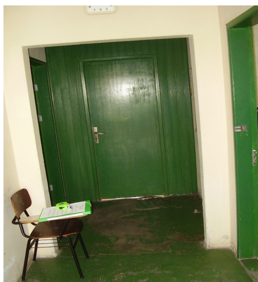
Hall de entrada e porta a retirar ao fundo

6 - Retirar a porta de madeira (1,70 x 2,80 m = 4,76 m 2 ) que divide a área dos canis, com os acabamentos que se fizerem necessários, e colocar nova porta em alumínio com pintura eletrostática na cor verde, linha 30, em duas folhas de abrir com visor em cada uma (40 x 60 cm) com vidro liso 4 mm no vão existente (1,26 x 2,10 m = 2,65 m 2 ).