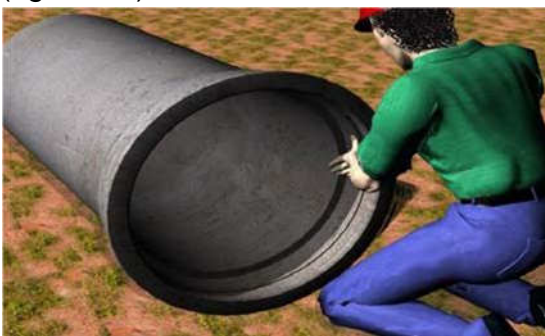
Figura 11 - Lubrificação do anel de borracha

Para o acoplamento, os tubos deverão ser suspensos em através de cabos de aço ou cintas apropriadas para içamento de cargas (figura 13), cuidando-se do seu alinhamento e do contato entre os extremos a acoplar. Durante esta operação, o tubo a