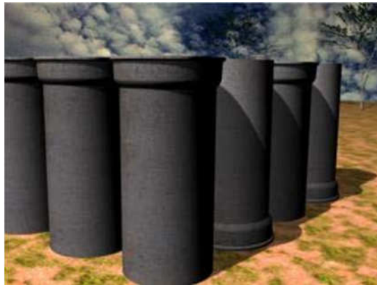
Figura 09. Tubos estocados na posição vertical