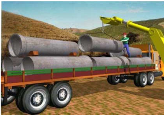
Figura 08. Descarregamento dos tubos

• Deverão ser descarregados nas proximidades do local de aplicação, de forma que possam ser trasladados com facilidade para onde serão instalados. No ato do descarregamento, devem ser manipulados com acessórios adequados, tais como cabos de aço ou cintas de nylon apropriadas para içamento de cargas.