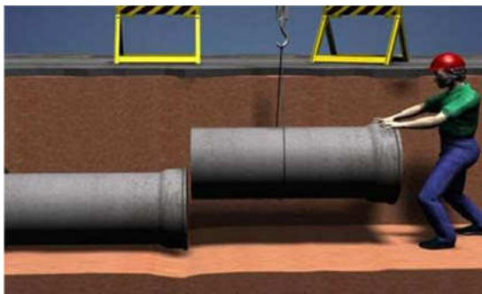
Figura 12– Acoplamento de tubos de concreto

ser acoplado não deve estar apoiado no fundo da vala, e sim suspenso (figura 12).