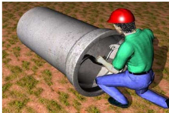
Figura 10- Colocação do anel de borracha