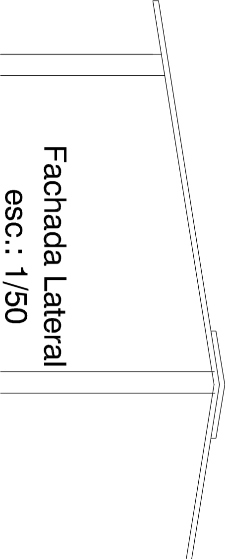
Fachada Lateral esc.: 1/50