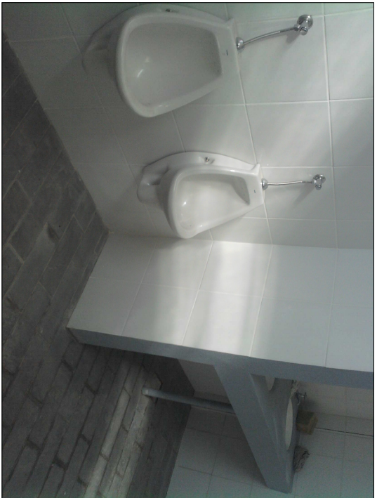
Foto 3 - Banheiro