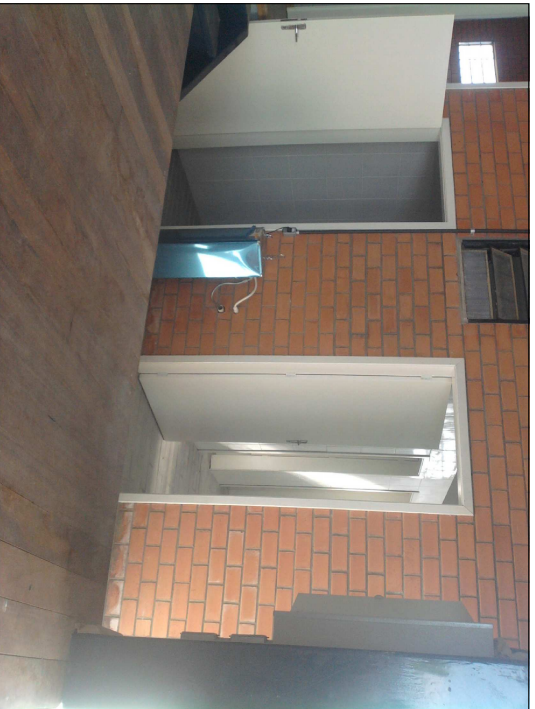
Foto 5 - Banheiro