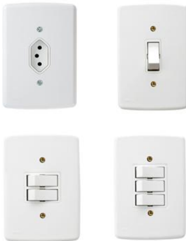
FIGURA 7 – Exemplo de modelo tomadas e Interruptores.