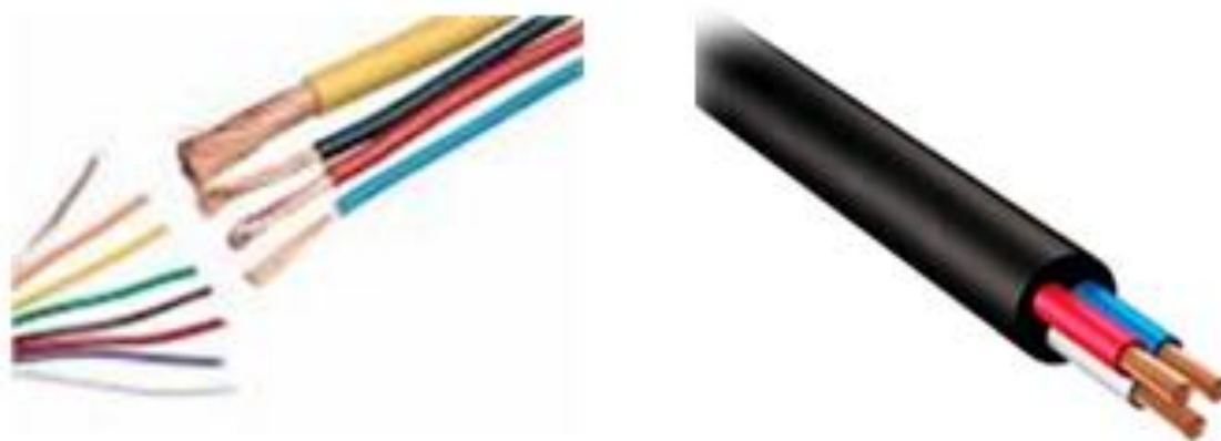
FIGURA 6 – Imagem Ilustrativa de fios e cabos.

Os cabos e fios elétricos (fase, neutro, terra) deverão ser identificados em suas extremidades, com numeração de seus respectivos circuitos, junto aos disjuntores e tomadas com anilhas de PVC.