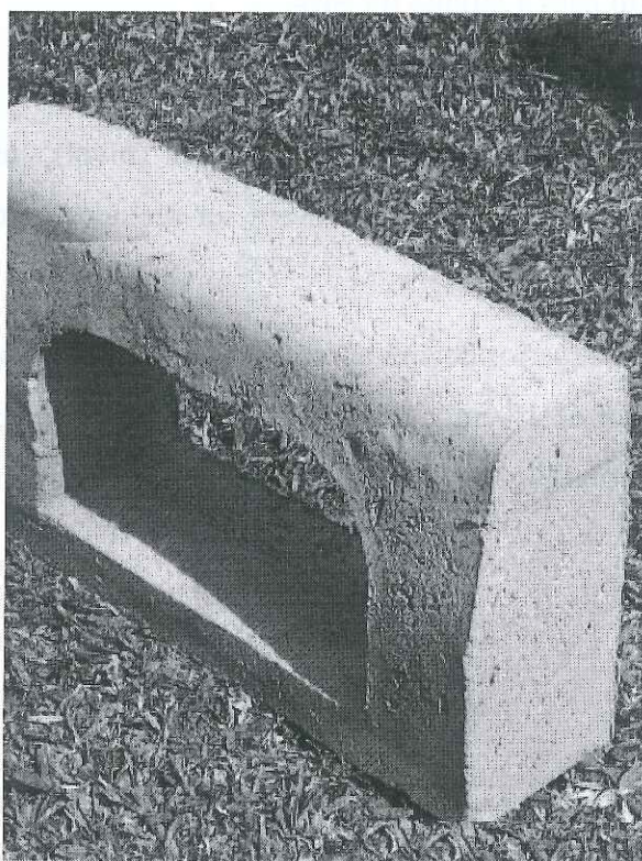
Figura 2 –Boca-de-Lobo de Concreto Pré-Moldado