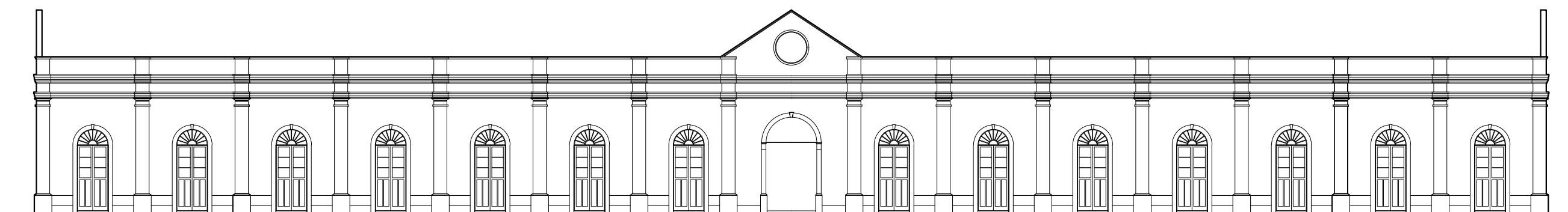
ELEVAÇÃO PARA A RUA RIACHUELO 1/100