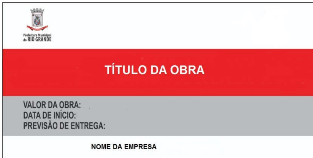
FIGURA 1 – Modelo de Placa Prefeitura Municipal do Rio Grande.

A placa deverá ser confeccionada em chapas planas, metálicas galvanizadas ou de madeira impermeabilizada, em material resistente a intempéries. Deverá ser fixada em local bem visível, preferencialmente na fachada principal da edificação, voltada para via pública que favoreça a visualização. Recomenda-se que a placa seja mantida em bom estado de conservação, durante todo período de execução da obra.